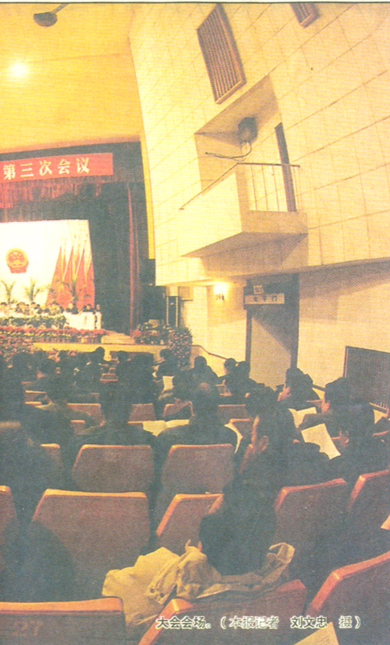
大会会场。

出席市政协四届三次会议的政协委员,市委、市政府有关部门的负责同志列席了大会。(本报记者 段东升)